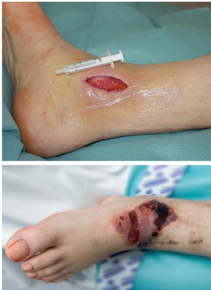
Abbildung 3: Defekte nach innerem Druckkulkus bei längeren, unbehandelten und unreponierten Sprunggelenksfrakturen.

In Abhängigkeit vom Gesamtbefund ist es beim geriatrischen oder multimorbiden Patienten auch durchaus vertretbar, bei einem hohen operativen Risiko auf einen Eingriff zu verzichten und eine Ausheilung in Fehlstellung zu akzeptieren.