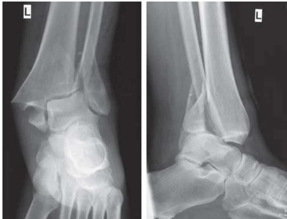
Abbildung 2: Röntgenbilder einer luxierten Sprunggelenksfraktur (in zwei Ebenen)

der dorsalen Seite der distalen Tibia, dem so genannten Volkmann-Fragment, kommt.